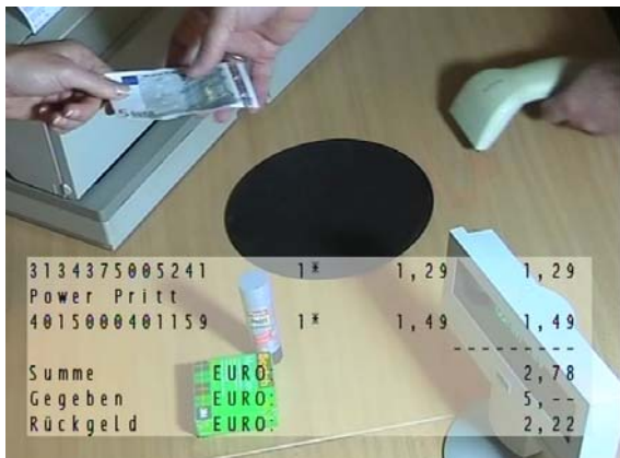
Beispiel: Scrollfeld-Darstellung eines Bondruckers

Dabei werden die Daten über den seriellen Port der Kasse (z.B. Printer/Kundendisplay) oder auch über das lokale Netzwerk (LAN) empfangen.