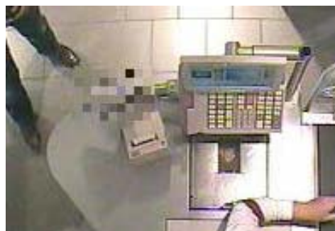
Beispiel: Verpixelung des PIN-Pad (EC-Cash)

Darüber hinaus können die dargestellten Informationen über die separate RS232 an einen Videoserver gesendet und dort in einer Datenbank für eine spätere Analyse mit Textsuche gespeichert werden.